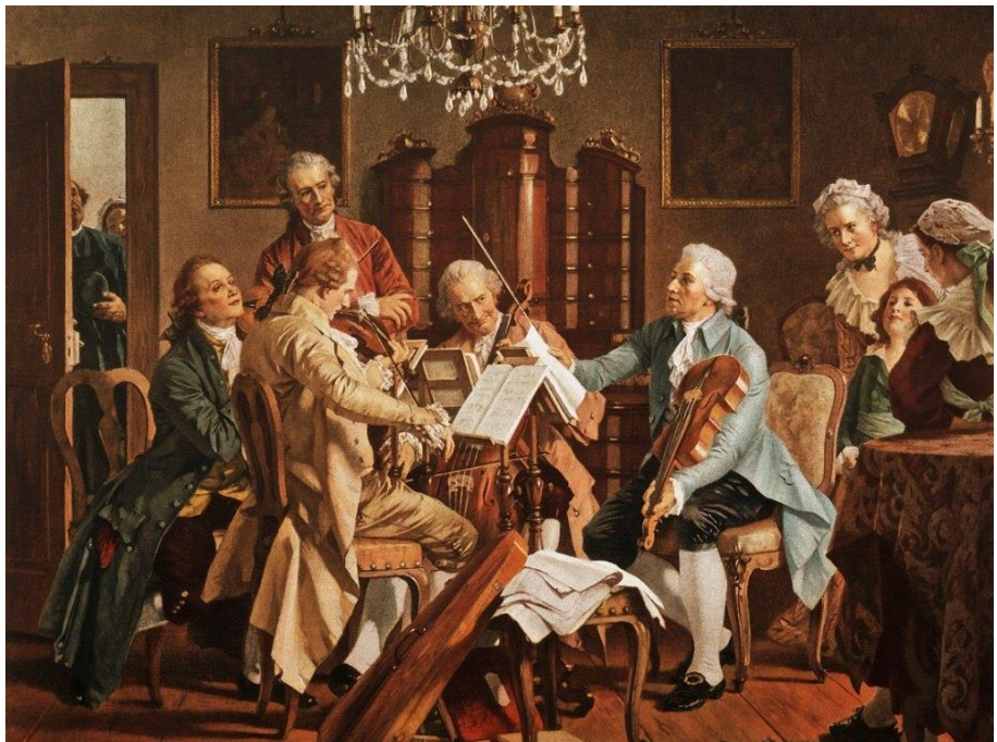
Joseph Haydn spiller strygekvartetter. Anonym kunstner fra før 1790 – Wien Staatsmuseum.

Kendskab til noder og musikteori er ingen forudsætning.