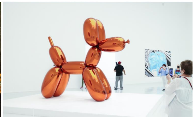
Jeff Koons: Balloon dog, 1994-2000