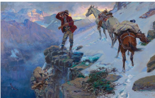
Charles Marion Russell: Meat's not meat till it's in the pan, 1915