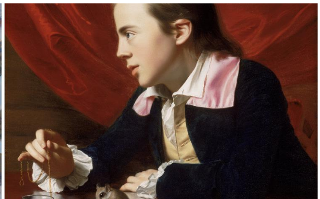
John Singleton Copley: En dreng med et flyveegern, 1765