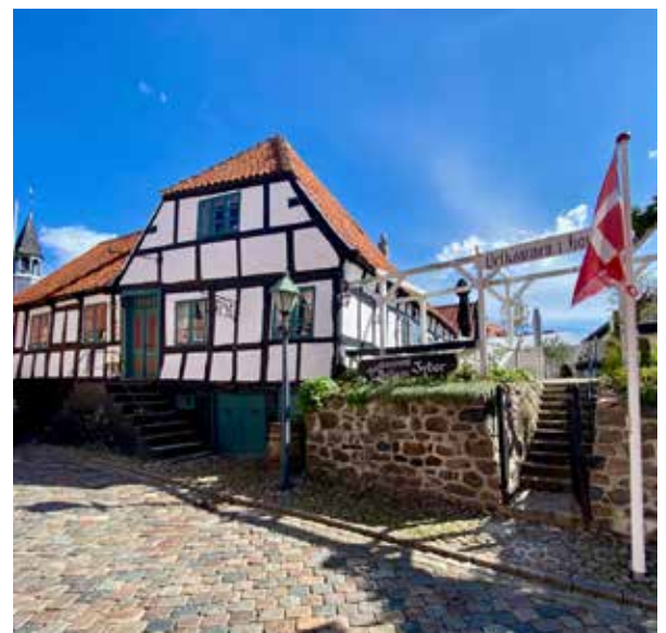
Restaurant Mellem Jyder, Ebeltoft