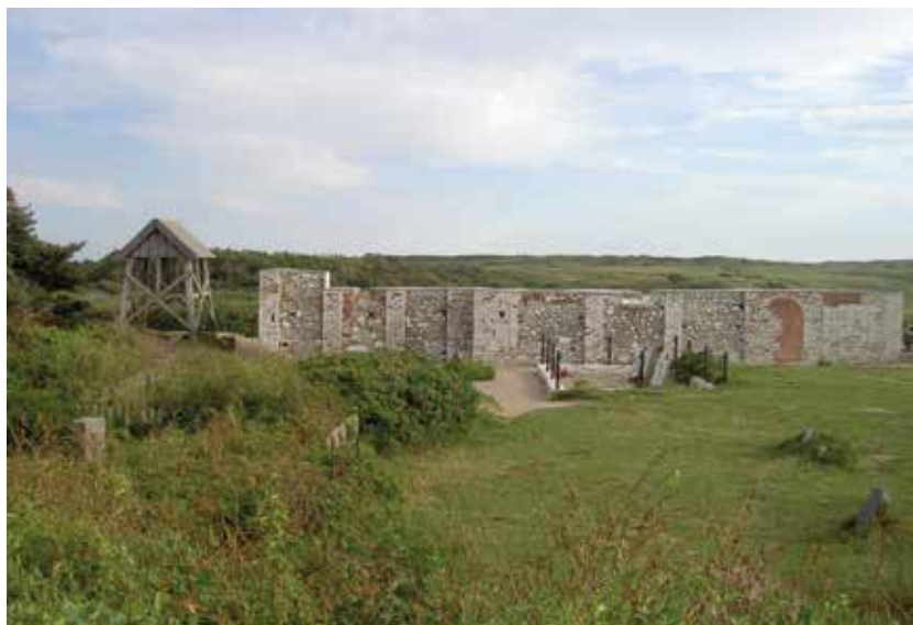
Mårup Kirke under nedtagning