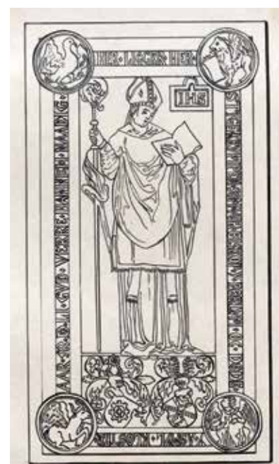
Stygge Krumpen, Biskop af Børglum

Kl. 17.00: Vi vender snuden retur mod Aarhus. Hjemkomst ved Musikhuset ca. kl. 19.15.