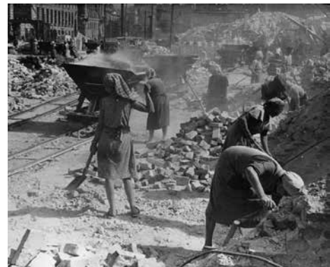
Trummerfrauen, Berlin 1945.

I foredraget følger vi Danmarks og danskernes forsøg på at finde plads i den verden, der voksede ud af krigens afslutning.