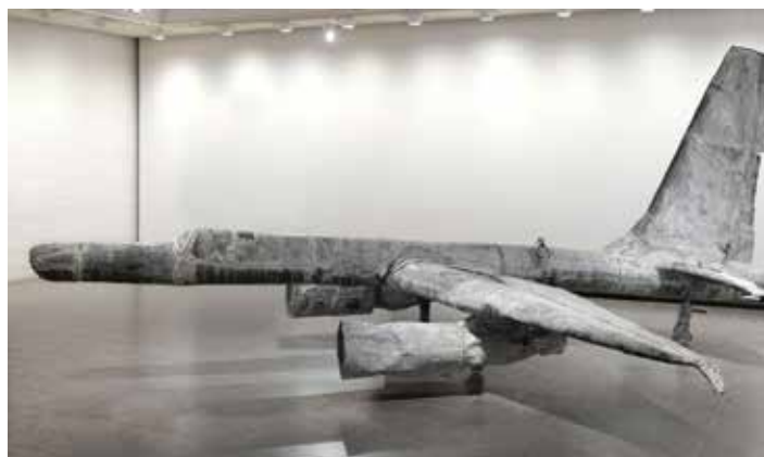
Anselm Kiefers værk Jason (1989).

Kiefer reflekterer over Tysklands historie, kultur og nationale identitet efter Anden Verdenskrig, herunder de historiske, moralske og etiske konsekvenser af det Tredje Riges diktatur. Han skaber i malerier, skulpturer og installationer et mikrokosmos af kollektiv erindring, ligesom han skaber visuelle referencer til religion, mytologi, musik og poesi. Kiefer er stærkt inspireret af den rumænskfødte, jødiske essayist og digter Paul Celan (1920-1970).