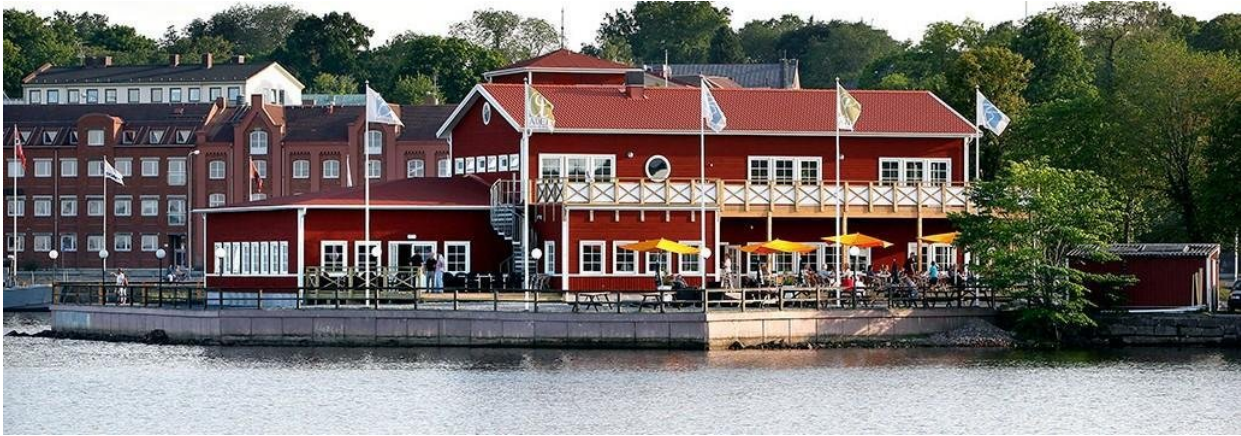
Restaurant Badholmen i Oskarshamn.

Efterfølgende er der afgang med færgen til Gotland, og der er god tid til at fordøje dagens oplevelser ombord, inden vi lige efter midnat ankommer til Visby. Vi kører direkte til vores hotel Best Western Solhem , som ligger midt i byen, og efter check ind siger vi godnat efter en lang dag.