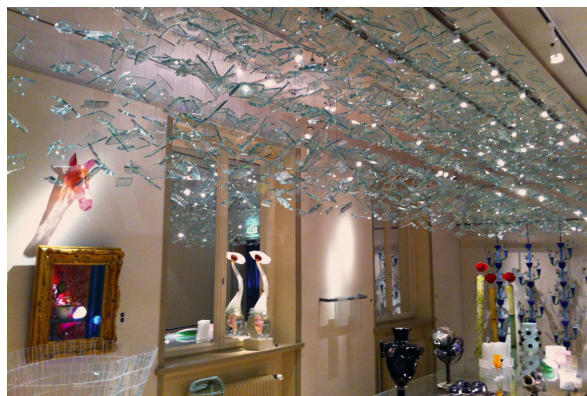
Smålands Glasmuseum.

Efter frokost fortsætter vi vores færd videre sydover gennem de smålandske skove til Skåne og et sidste stop for en kop eftermiddagskaffe. Og så har vi ikke langt til Øresundsbroen og videre over Sjælland hjem, hvor vi forventer at være i Ringsted kl. 18.50, Slagelse kl. 19.10, Sorø kl. 19.30 og Næstved kl. 20.15.