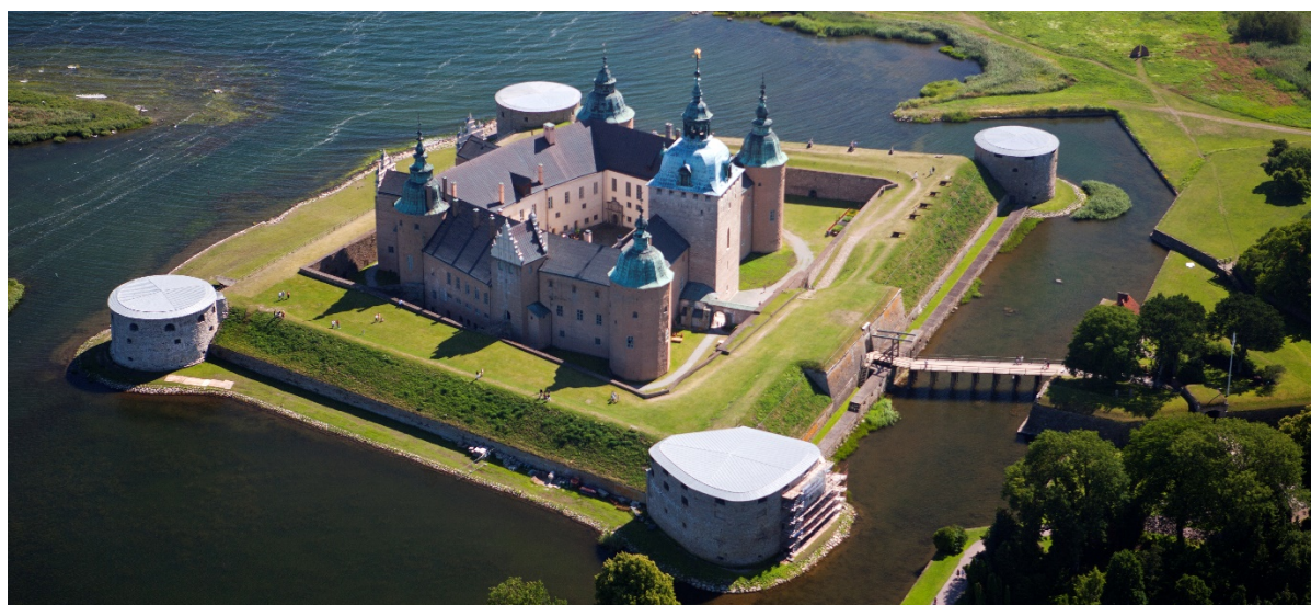
Kalmar Slot.

Efter godt 3 timers kørsel, venter frokosten på os i Dalskärs Sjöfrog i Bergkvara, hvor vi kan nyde havudsigten inden vi kører videre mod den gamle dansk-svenske grænseby Kalmar. Vi går en lille tur gennem byen til domkirken inden vi kører videre.