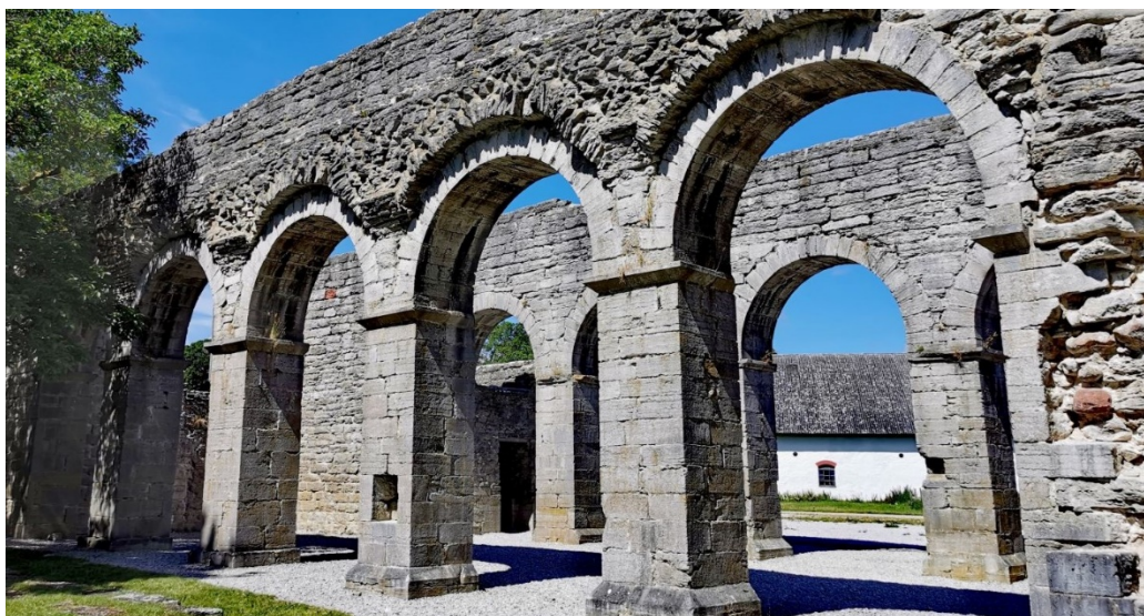
Roma Klosteruin.

Efter morgenmad checker vi ud fra hotellet og kører til den nordlige del af Gotland og tager med den lille færge over til Fårö. Her kører vi til Digerhuvud, som er Sveriges største raukområde. En rauk er en forvitret klippeformation, hvor de blødere sten er eroderet væk af havet og tilbage står det hårdere kalksten. Her går vi tur, nyder udsigten og lader fantasien afgøre, hvad raukerne mon ligner. Men Fårö er nok mest kendt for instruktøren Ingmar Bergman , som i mange år boede og arbejdede her. Flere af hans film er indspillede på øen. Vi besøger Fårö kirke og kirkegården, hvor han ligger begravet. Vi forlader Fårö og er tilbage i Visby sidst på eftermiddagen til færgeafgang kl. 16.50. Vi sejler tilbage til fastlandet og der er mulighed for at købe aftensmad ombord på færgen. Vi er i Oskarshamn kl. 20.00, hvor vi kører direkte til Sjöfartshotellet. Da aftenen stadig er ung, vil nogle måske med på en lille aftenpromenade.