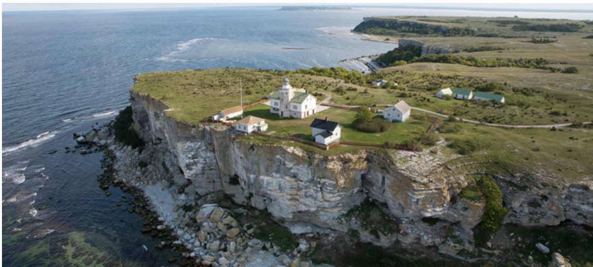
Stora Karlsö.

Vi ser den sydlige del af øen og første stop bliver Gannarve Skibssætning fra bronzealderen, hvor vi laver et kort stop. Vores mål er den mest kendte rauk, Hoburgsgubben, som ligner et mandehoved. Vi fortsætter til Lars Jonssons museum , som ligger i Vamlingsbo gamle præstegård. Her udstilles kunstnerens mange smukke fuglebilleder. I nærheden ligger Naturum Gotland , som fortæller om den gotlandske natur. Efter frokost kører vi til Grötlingbo Kirke, hvor Asger Jorn ligger begravet på kirkegården. Gotland har ca. 100 middelalderkirker, og fra Grötlingbo kører vi langs Eksta kysten tilbage til Visby. Her får vi en fantastisk udsigt i klart vejr til Store og Lilla Karlsø, som verdens næst ældste naturbeskyttede område efter Yellowstone i USA. Om aftenen samles vi til en fælles middag på hotellet.